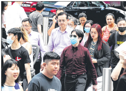
新加坡统计局《2022年住户收入主要趋势》报告显示，反映居民住户收入差距的基尼系数，从2021年的0.444，降至0.437。

这主要是因为政府在2022年推出的多项一次性、加强版和过渡性援助措施，以缓解消费税上调及通货膨胀走高对生活费的影响。